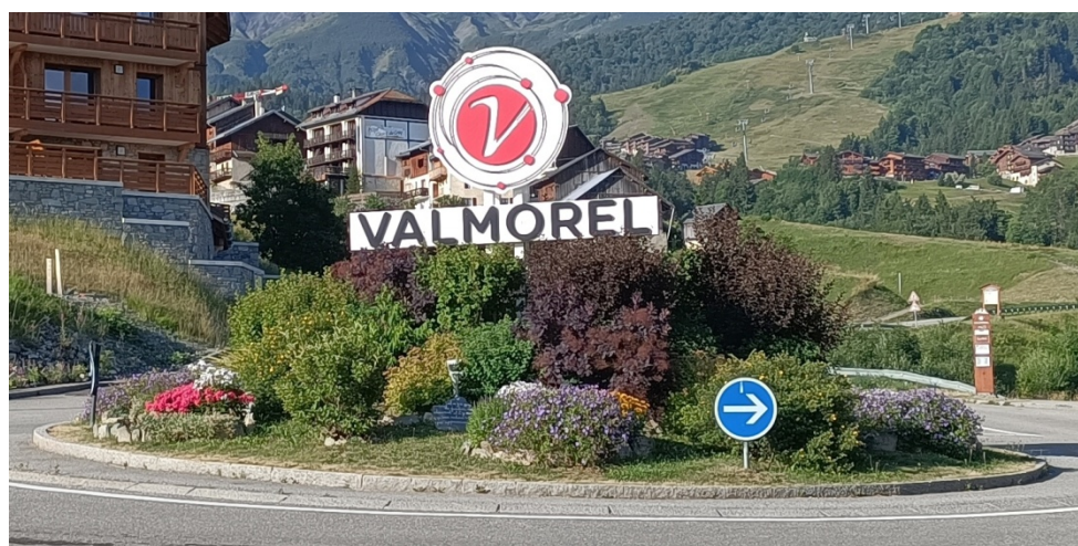
Direction La Charmette – Le Pré – Le Crey