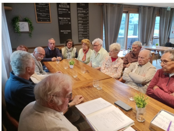
Notre rencontre été 2025